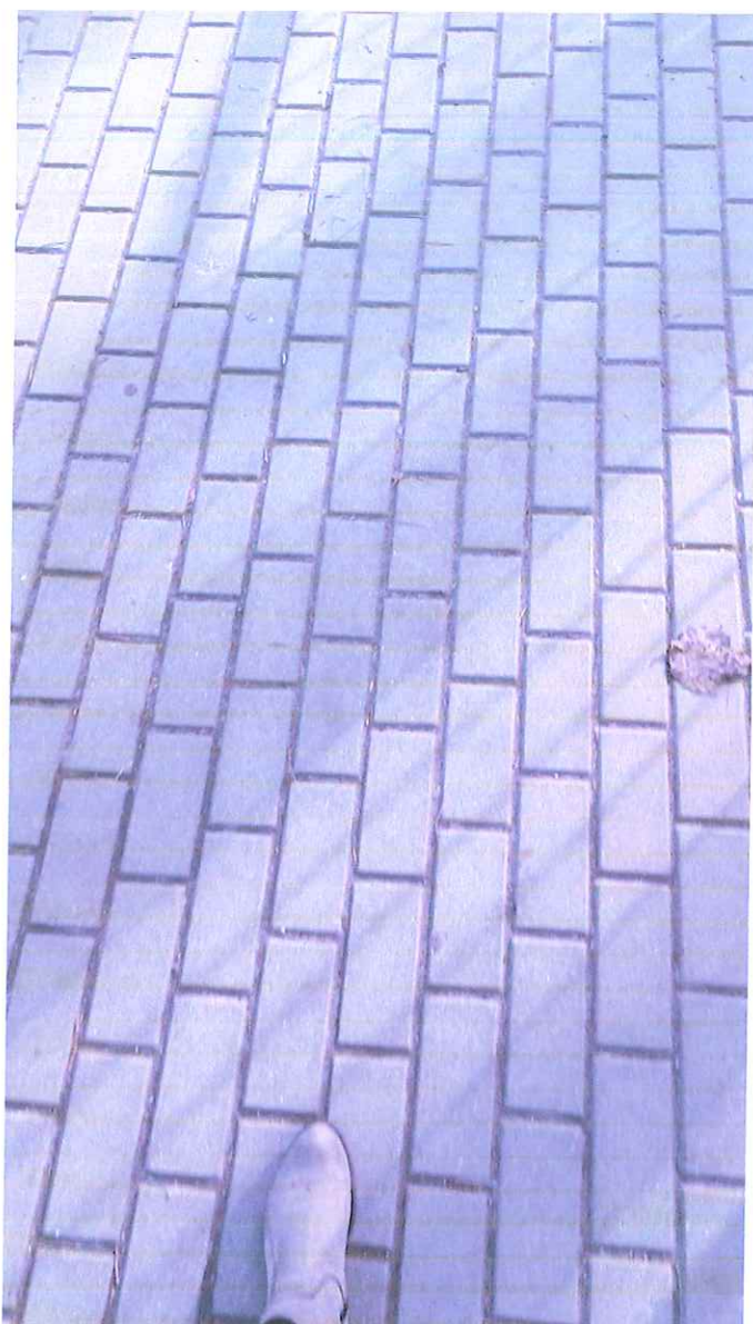
Tak wygląda pięknie wyremontowany chodnik pomiędzy ul. Kresową a ul. J Korczaka za który serdecznie dziękuję.