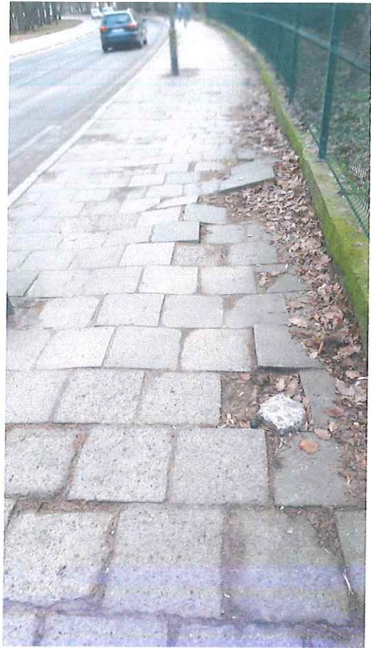
Z każdej strony z wyremontowanych chodników wchodzi się na łuk o którego naprawę zwracam się.