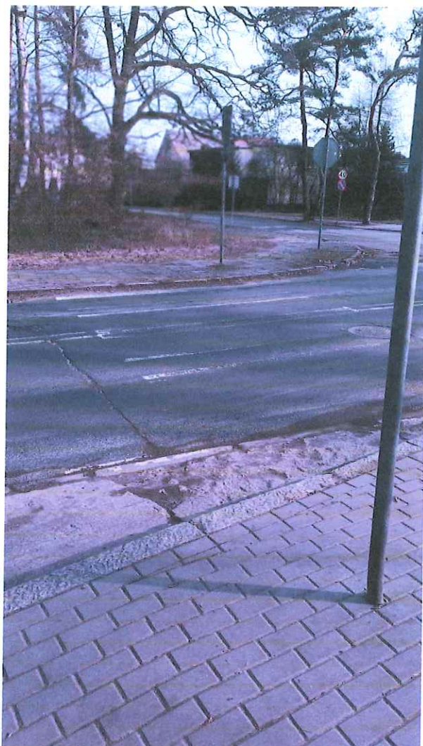
Tu mamy przejście na ul. Chodkiewicza, gdzie chodnik jest także w bardzo złym stanie technicznym