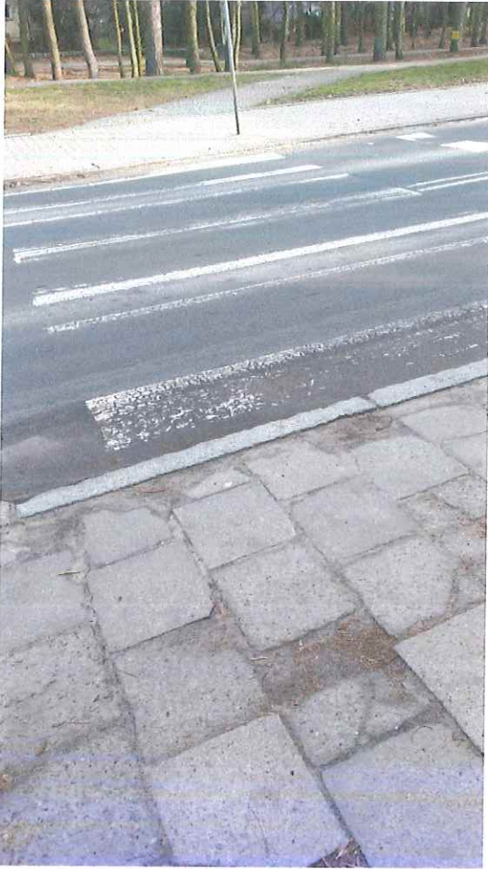
To jest przejście na ul. Piłsudskiego, gdzie po drugiej stronie znajduje się wyremontowany chodnik.