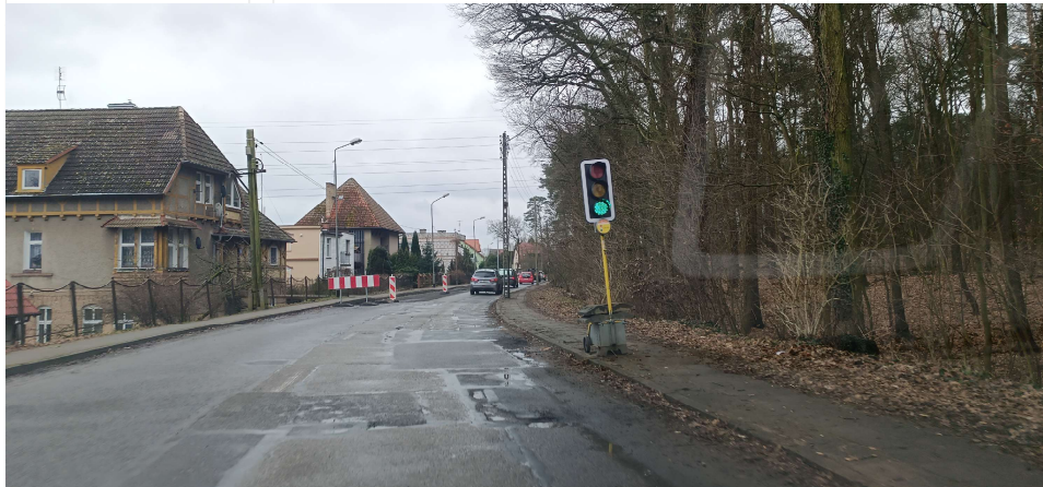
Prace na Nadbrzeźnej i Cisowej w Policach potrwać 12 miesięcy, a ich wykonawcą jest firma Eurovia Polska Sp. z o.o. Inwestycja obejmuje wymianę nawierzchni jezdni oraz chodników i przebudowę kanalizacji deszczowej

Zima nie sprzyja drogom. Nagłe zmiany temperatury, mróz i duża ilość opadów niszczą nawierzchnie jezdni, powodując wiele ubytków. Powiat Policki podpisał z firmą STRABAG Sp. z o.o. z siedzibą w Pruszkowie umowę na realizację remontów cząstkowych dróg powiatowych. 13 lutego firma rozpoczęła łatanie dziur na drogach. Zgodnie z harmonogramem w pierwszej kolejności remonty są przeprowadzane na najbardziej zniszczonych odcinkach. Faktem jest, że remontu cząstkowego wymagają praktycznie wszystkie drogi powiatowe, z pominięciem tych, które były w ostatnich latach przebudowywane.