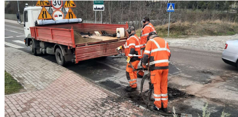
Trwa łatanie dziur na drogach powiatowych

Powiatowe w Policach ogłosiło przetarg na modernizację fragmentu ulicy Piłsudskiego w Policach - od ul. Tanowskiej do ul. Wyszyńskiego. Nawierzchnia będzie wymieniona do czerwca tego roku. Zadanie polegać będzie na wykonaniu cienkiej warstwy bitumicznej na zimno (Slurry Seal), ułożonej w dwóch warstwach o łącznej grubości do 2 cm. Wspomniana metoda jest stosowana w krajach Europy Zachodniej i USA. Polega na wylaniu przez specjalistyczną maszynę cienkiej, elastycznej masy, w skład której wchodzi emulsja asfaltowa, kruszywo bazaltowe, cement i specjalne emulgatory przyspieszające twardnienie. Jej zaletą jest szybkość wykonania, duża szorstkość nawierzchni i czas. Ponieważ masa kładzona jest na zimno, oddanie drogi do użytku możliwe jest już po 30 minutach. W ramach remontu Piłsudskiego drogowcy wykonają naprawy